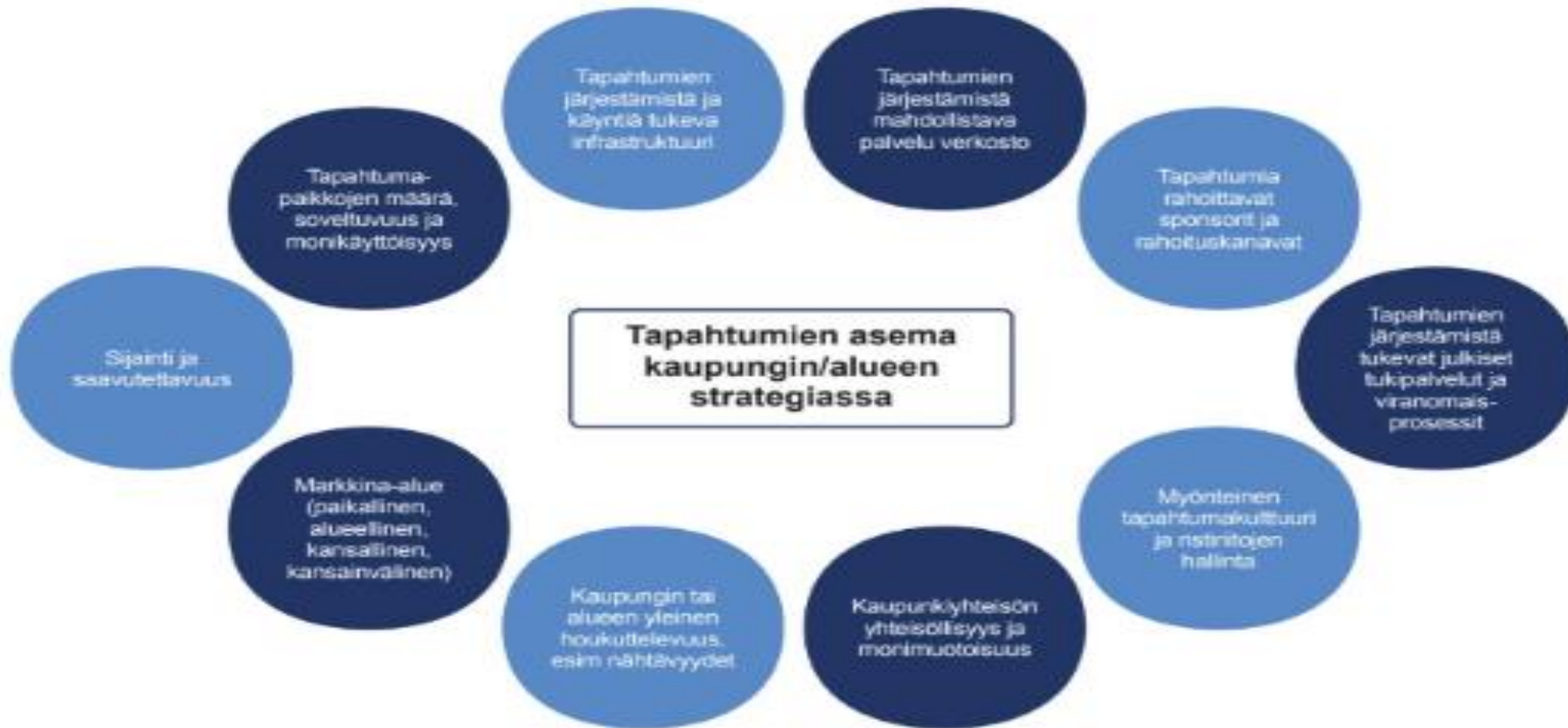
Kuva 2: Tapahtumien maturiteettikehän avulla voidaan kehittää alueiden ja kaupunkien kyvykkyyttä tapahtumajärjestämiseen. Työ- ja elinkeinoministeriö 2023.